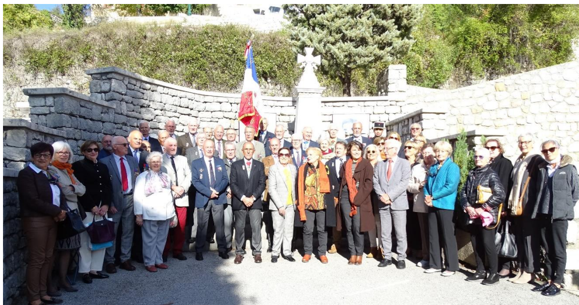
Figure 1 Rassemblement devant le monument aux morts.