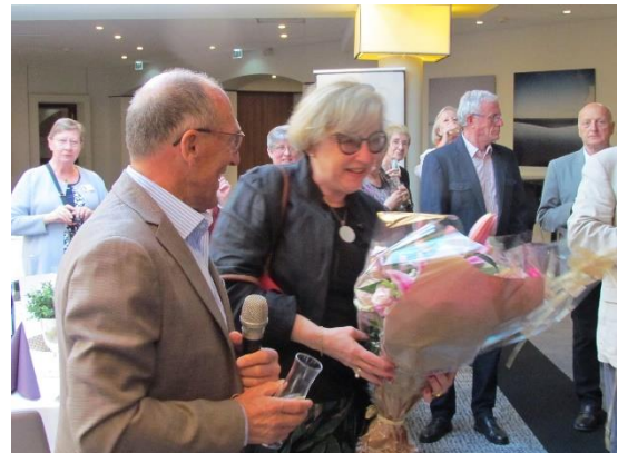
Les remerciements à Isabelle