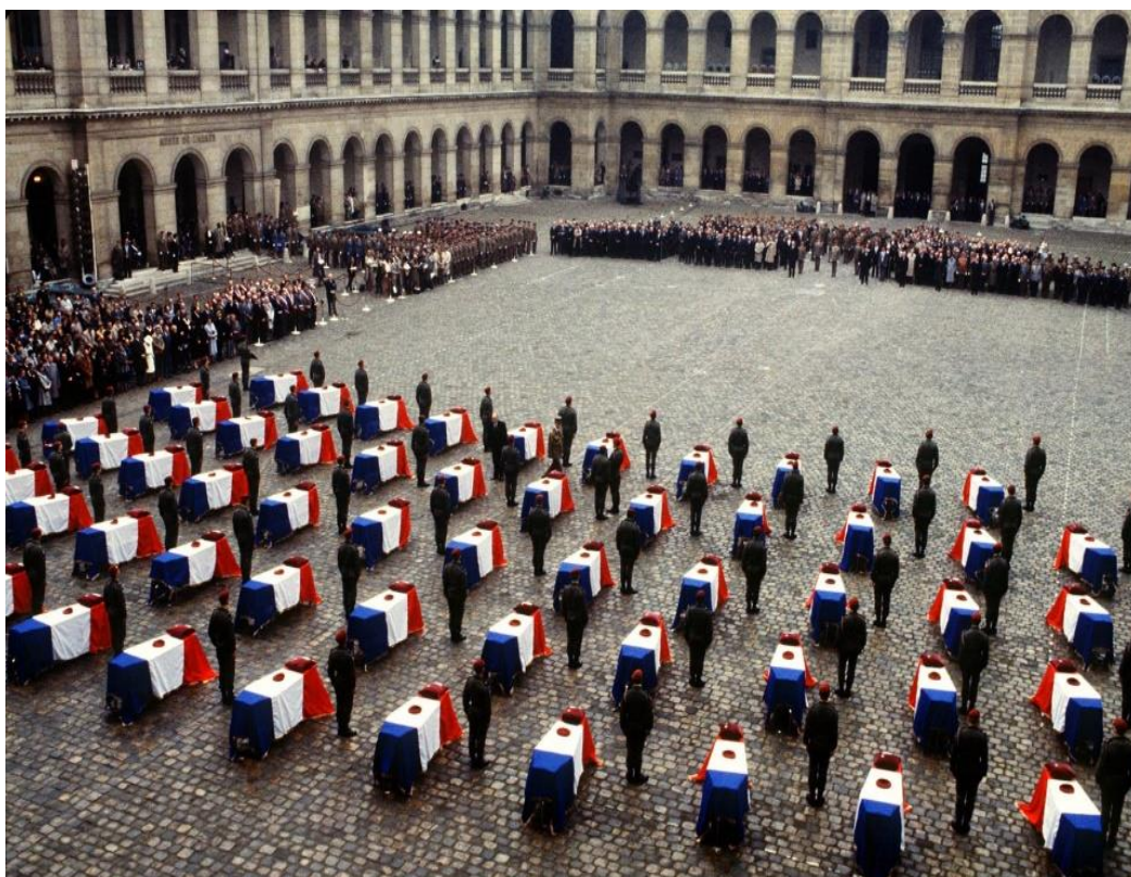
Cour des Invalides en 1983 - Obsèques des 58 victimes

Vive la République ! Et vive la France !